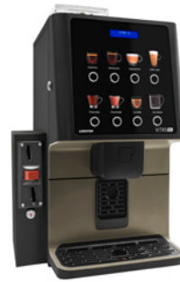
Kit Validierungsmodul Vorbereitet zur Installation eines Münzprüfers.