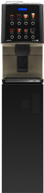
Kit Sockel Vorbereitet für Münzprüfer. (850 mm.)

Auch für den Kaffeeservice in Lebensmittelgeschäften ist sie die perfekte Lösung und für Hotels, in denen das Frühstück gut, aber ebenso schnell sein sollte, bietet die Maschine ein angenehmes Erlebnis, mit einem attraktiven Design, einfach und funktional.